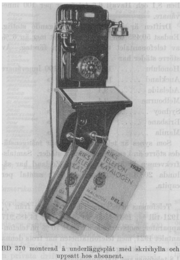
BD 370 monterad på underläggsplåt med skrivhylla och uppsatt hos abonnent.

Underläggsplåten är tillika avsedd att mot särskild avgift tillhandahållas abonnenter , som önska erhålla CB- eller AT-väggapparat med skrivplåt. För att bli mera praktisk i detta avseende är den nedtill försedd med tvenne pinnar för upphängning av telefonkataloger. Den ovannämnda rengöringen av cellonskivan bör givetvis hos abonnenterna ombesörjas av vederbörande själva.