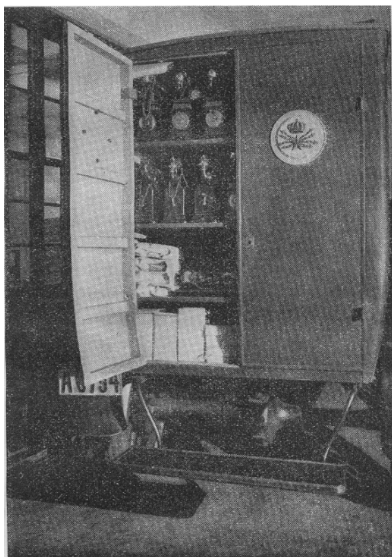
Fig. 4. Apparatbilens inredning (bakifrån).