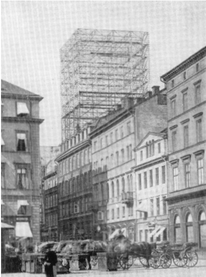
Telefontornet i sitt ursprungliga skick innan de fyra hörntornen kom till.