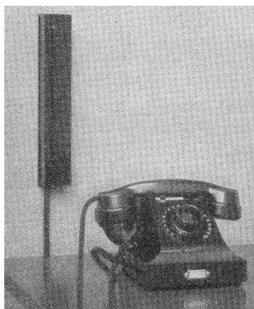
20 linjers självväljare

Kopplingsboxarna tillåta inkoppling av upp till 4 kablar, två i vardera rännan. I detta fall är det lämpligt att inkoppla en av kablarna på varje sida till översidans, och den andra till undersidans kopplingskarvar.