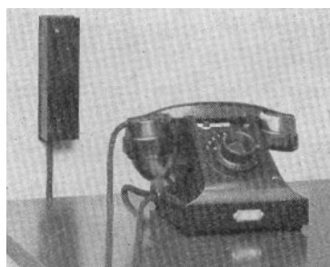
10 linjers självväljare